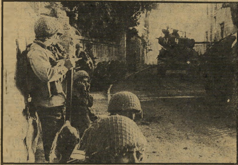
כיבוש ירושלים: יוני 1967 חומר הנפץ נשאר

ייתכן שרק בעוד חמישים או מאה שנים יוכלו ההיסטוריונים לקבוע אם התאריך