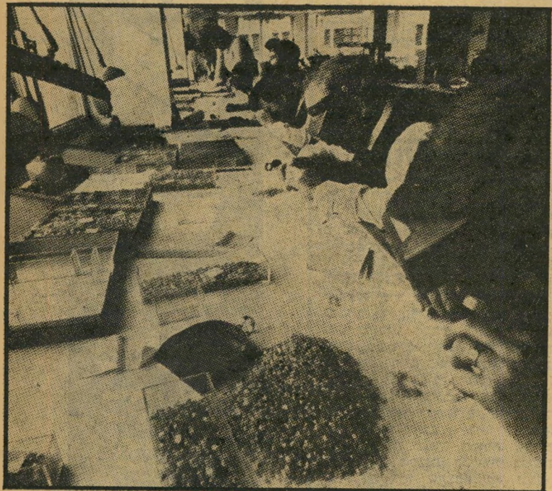
יהלומנים בסינדיקט הלונדוני באנקו

לקראת הקונגרס הבינלאומי של היהלומנים, שנערך באחרונה בישראל, ניסו ראשי בורסת היהלומנים להסביר את הריב בינם לבין הסינדיקט הלונדוני, ש"הטיל היטל מיוחד של 40% על היהלומנים הנמכרים בעיקר לישראל. הם ניסו גם להסביר מדוע נוצר מחסור מלאכותי של יהלומיגלם במשך חצי-שנה, מדוע עלו מחירי הגלם תוך שנה ב-100 אחי-