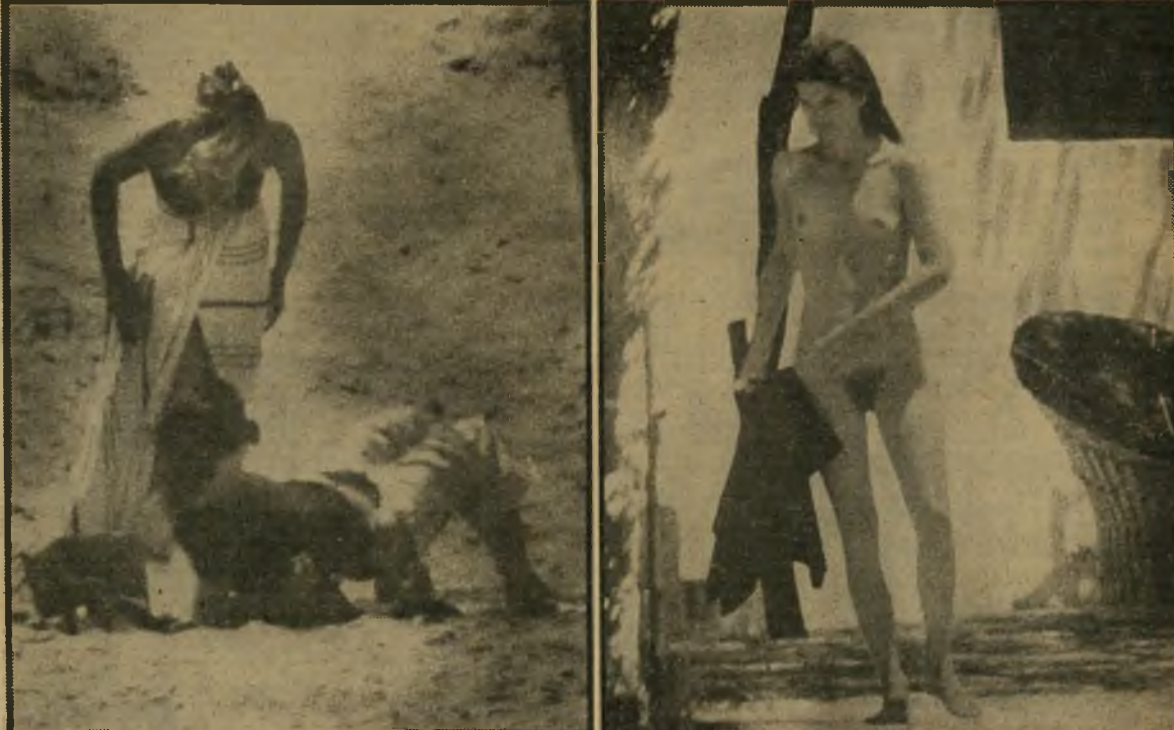
ז'אקלין קנדי-אונאסיס באי סקורפיו ובחוף קיסריה שיחזור