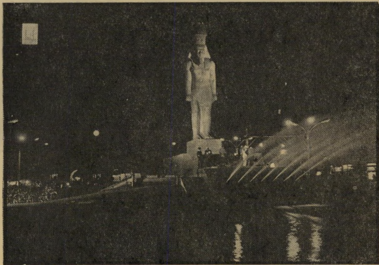
פסח רעמסס בכיכר רעמסס בקאהיר * האם ישחרר בגין את הפיראמידות?

"אחרון הפרעונים". כאשר כבשו כוחות צה"ל שטח מצרי ממערב לתעלת סואץ, הם קראו לו בשם התנ"כי "גושן". כאשר ביקרו הישראלים בקאהיר וראו את פסל-הענק של רעמסס בכיכר המרכזית ואת רעמסס החנוט במוזיאון, נזכרו בשם רעמ-