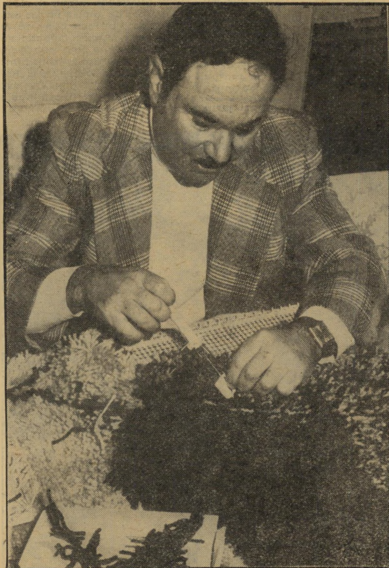
אמוראי משתמש במכשיר השחלת חוטים

כדי עבודה. כיום עומד הח"כ החרוץ בפני סיום היצירה. נותר לו עוד מיטטה קטן באחד מקצוות השטיח, שאותו הוא מתכוון לעטר, במקום חתימה, ב"חאמסה", כיוון שעשיתי את השטיח בעבודתי, כדבריו. החברים והמכרים המזדמנים לביקור בבית אמוראי מתפעלים מן היצירה הכמעט-מוגמרת וטוענים שחבל לפרוש אותה על הרציפה, כדי שתשמש למידרד-רגליים. השטיח, לדעתם, חייב להיות תלוי על הקיר. אף אחד מהם לא צוחק או מלגלג על העיסוק הלא-כליכך גברי