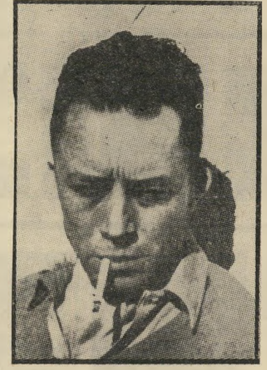
אלבר קאמי משמעות העונש

בלשון של גוף ראשון ובמתח פנימי רב מספר מארסו גיבור הספר "הזר" מאת הסופר האלגורייצפתי אלבר קאמי את קורותיו החל מאותו יום בו נפטרה אמו ועד לפני הוצאתו להורג בעוון רצח ערבי בחוף אלג'יר. קאמי (חזן) פרס נובל 1957) מציג בלשון סיפור זו את תיאור לוויית אמו של מארסו, אהבתו של מארסו, דמויות ידיו ושכניו. עבודתו