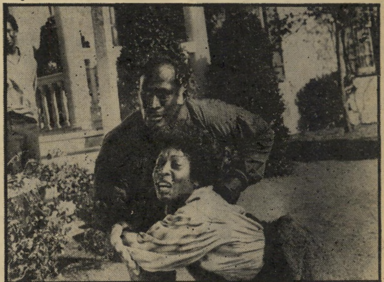
"שורשים", המלך הוא עירום

לאחרונה הודיע חסין כי הוא יגיש לי מיכרז לתפקיד מנהל-החדשות כרדיו. אי לש אנשי המערך טוענים כי אם הוא אכן ייבחר, תהיה זו "הצנחה מגבוה" של איש שאינו איש-מיקצוע אלא פקיד, ובעיקבות הצנחה זו תיפרץ הדרך להצנחת מגבה של אישים שונים מקורבים לליכוד, מכ לי שלאנשי-מיקצוע תהיה יד חופשת, להיבחר, ללא כל השתייכות מיפלגתית.