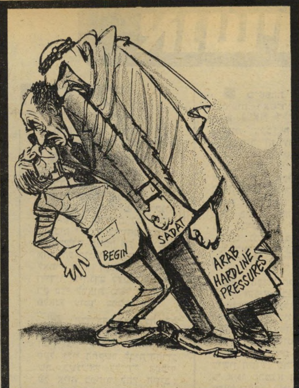
הרבזוק: "מדוע אינך יכול להיות יותר גמיש?"