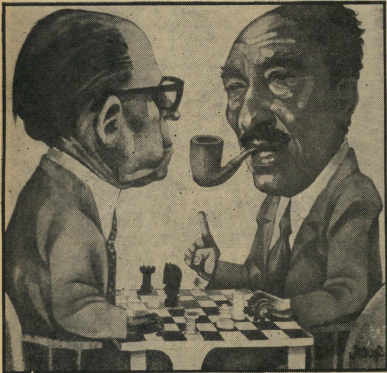
* סאדאט ובגין: "רוז אל-יזסוף" קאהיר