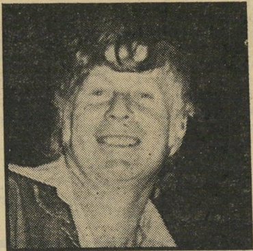
יחיאל חזק גסות

להפתעתי הרבה הצלחתי לקרוא את מורו של חזק הפעם עד הסוף. סינננו הגרוע מוכר לי, אך משפט אחד וצבוע שלו הצליח להוציא אותי מבלי: "אולם אין הדיון בהרעלת מילים זו מענייננו כאן..." כתב חזק כשהוא מנסה בחוסר ה— כישרון האופייני לו להסוות את התקפתו