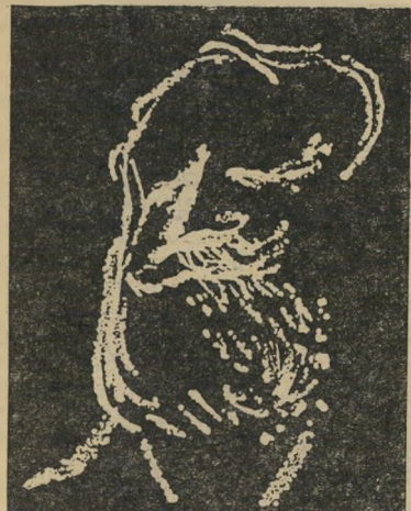
ג'ורג' ברנרד שאו ללחום עד שיתעייפו

מלחמת השחרור, צוטטה בשבוע שעבר תגובתו של הסופר והמחזאי הבריטי ג'ורג' ברנרד שאו לבעיית ארץ-ישראל: "בשיחה עם סופר איוונינג סטנ— דרד אמר שאו כי מחוץ לנטיעה דרך א"י ורחיצה בכינרת אין הוא יודע הרבה יותר על א"י מאשר כל קורא בעיתונים. שאו טען כי זכויות גזעיות בהסתמכות של יהושע (בנון) (הנביא) מוחזמו אינן קיימות ובדרך ההיגיון יכולים היהר דים והערבים להסתמך רק על זכויות כ—