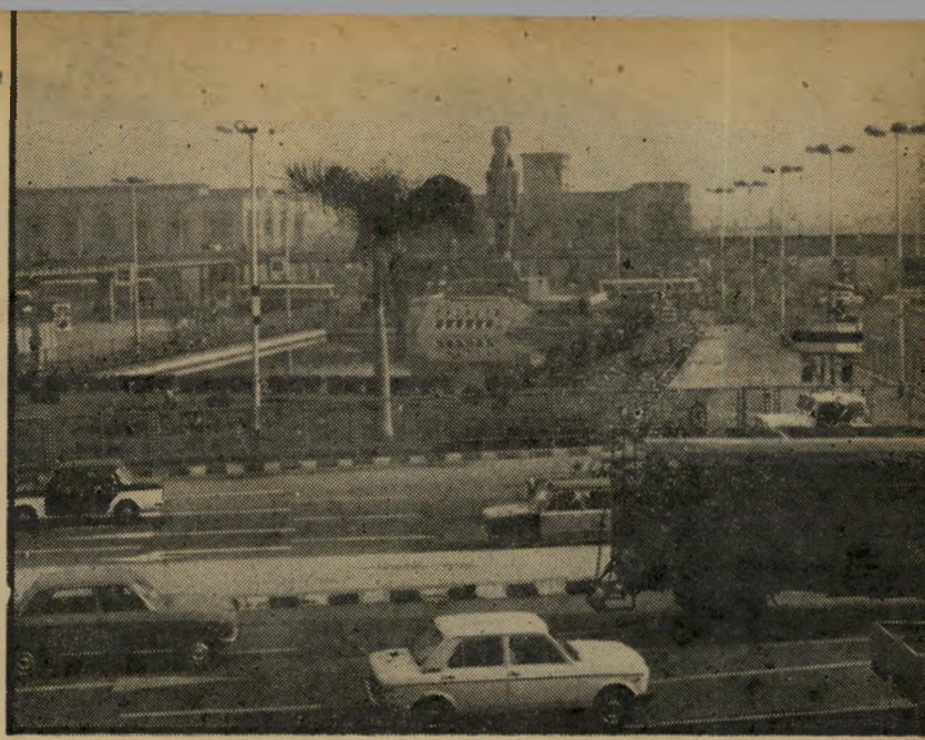
כסל רעאסס ניצב במרכז אחת הכיכרות ההומות של קאהיר. בתמונה ניתן להבחין בגשרים עיליים להולכי-רגל, המשמשים להם כמעבר-יחצייה, בקצה הימני נראה המיגדל של שוטר-התנועה המכוון את התנועה הסואנת.

שאלנו את נערת-הדלפק מה לעשות. אמרנו שאנחנו ממשיכים לקאהיר. "עוד היום?" שאלה. ענינו בחיוב. "אם כן, אפשר לעשות למיזודות צ'קאין עכשיו," אמרה. היא ביקשה את הכרטיסים. בטעות מסרתי לה את הכרטיסים תל-אביב-אתר. נה, היא לא ראתה בזה כל דבר מיוחד. וקיבלה לידיה את הכרטיסים האחרים, לקאהיר. בשבילה אין כל דבר מיוחד בעובדה שאדם נוסע מתל-אביב לקאהיר. סוף-סוף מצמידים למיזודות את התג המיוחד - C.H.I. - והן נעלמות בסרט הגע. לרגע עולה בלב חשש: האם הן