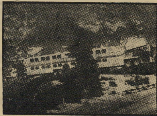
אוטובוס התשוקות: גם מרגע לרגע

הצרים מזכירים ברמתם את המערכונים הפחות-מוצלחים מתוך אהבה נוסח אמריקה (שכמה משחקניה קבועים מופיעים כאן) קשה להתפעל מן המוצר הסופי.