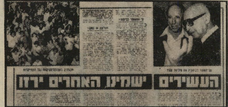
הכתבה על הפיחות, "העולם הזה" 1941 (13.11.74) הוראה מפורשת

"המדיניות הכלכלית החדשה נושאת על פרצופה את תוויה-הפנים של ממשלה זאת, של ממשלה כזאת", הגיב העולם הזה על המדיניות הכלכלית של רבינוביץ (העו' 1941). אין ספק, דרושה מדיניות חדשה, דרושים קורבנות, הוויכוח אינו על הצורך במדיניות ובקורבנות, אלא על ה'