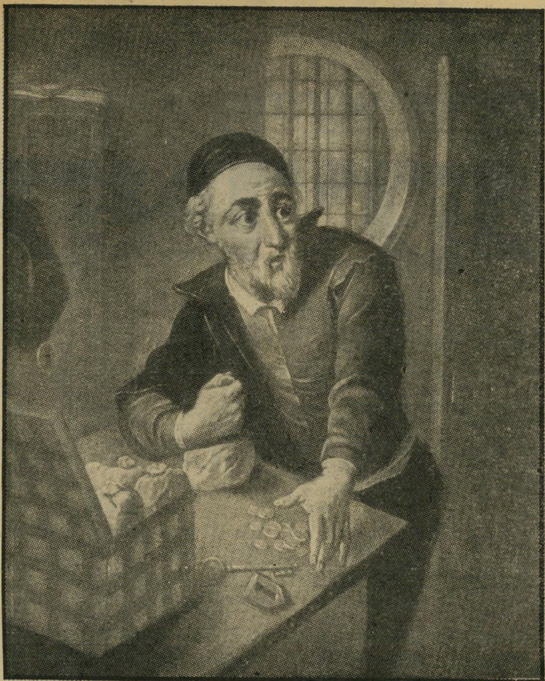
„הקמצן היהודי“ (קאריקטורה מהמאה ה-17)

נעוצה בכך שעתה נעשה הכז כי גלוי, כפה מלא, בהכרה מלאה, כי חדרוה.