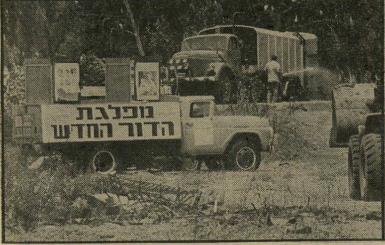
מכונית "הדור החדש" במיזבלת חיריה דרך כל מיפלגה

המערכה הציבורית שמנהל ח"כ אולמרט עד שראיתי את הופעתו בטלוויזיה בעיקר בות פירסום הקלטת שיחתו עם איש הפנתרים השחורים. עכשיו הכל ברור. האיש הוא ממש חולה רדפה. פינקל, תל-אביב