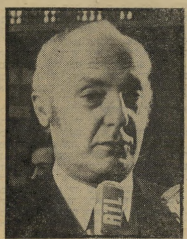
אשר בן-נר מונפול לפילהרמונית