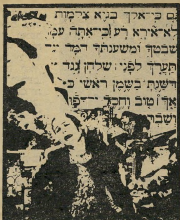
"מועגל הגיר הפלסטיני" יותר התעניינות

עיר הוא סיפור מתוחכם. אלגוריה חללית לאיכות החיים של עולמנו. ספר שבו פועלים על שני מישורים סיפוריים האקט' לוגיה היומיומית והאיכות של המגע הבינאנושי. תוך ביקורת תוקפנית לכניעת האדם בפניהם.