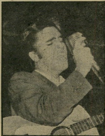
אלבים פרסלי 12 קארליקים לבנים

מתו בטרם-ענת של הפסל יצחק דנציגר מתאונת-דרכים לא זכה בכיסוי בכלי-