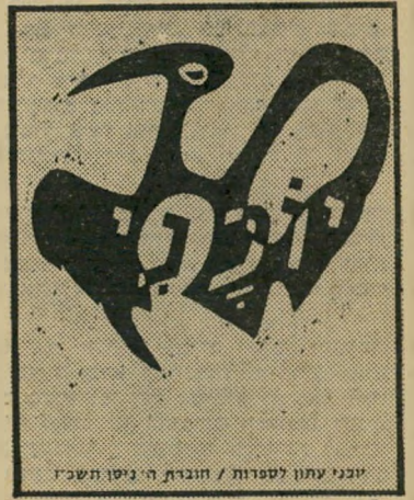
יוכני 60000 כרמים

בימים אלה הגיעו לארץ עותקים של כתביהעת הסיפורית ביצרון (הוצאת ניסן-איר), המופיע בעיברית ובארצות-הברית. בחוברת מצוי מאמר שנכתב לפני הבחירות לכנסת עליידי איש-הספר היהודי-לוד. אברמסקי תחת הכותרת על הבחירות לכנסת. מסמאמר זה קובע אברמסקי שהספרי-סמור ייגאל ידן אינו יודע עיברית. למרות עיסוקיו בארכיאולוגיה, וכך הוא כותב: "אנשי-הבינה-לעיתים-של-כחירת, הי ירעם לנחש ולמצוא את התוצאות, חור זים ניצחון ניכר לרשימה החרשה דיש, שבראשה הספרסמר ייגאל ידן, ואחריו אלופי-צה"ל לשעבר ואנשי-מעשה בהווה. הרשימה הזאת מתוכנת בין הי-שפאל' יכין הימיון, ומבאן סיכוייה. אנשי דיש תר לים תקוותיהם בפרס' ידן : עוד לא פג קיפסד, לא תש כזה שכפיו. ואצמם, איש שפתיים הוא ידן. אבל, כדבר אחד כמדוד ככל הארכיאולוגים בישראל : לא איש-שפת. כל הנפשות היו במקמד הר-סיני. כיצד איפוא קרה, שלא כל ישראל