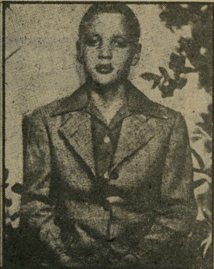
בר'חיצוה ניים במתנה ליום הולדתו וקיבל גיטרה. אלביס בגיל 13. הוא ביקש אופי' ברי'חיצוה. קאובי לא קרא תווים, למד לנגן מהאזנה. בעיירת הולדתו טופלו. הוא אלביס בתליבושת בוקרים