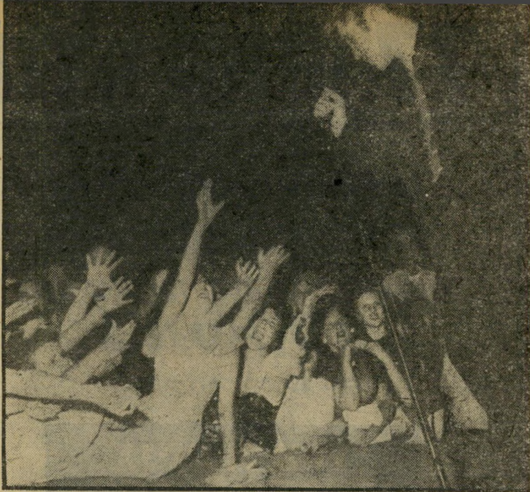
הטירוף הגדול ממפיס, טנסי, ה' 5 ביולי 1956. חודשים ספורים בלבד אחרי שאלביס פרסלי החל בטיבובי הופעות החיות כבר החלו מחזותי הטירוף שהפכו סימן היכר שלו: מאינות היסטוריות משתוללות וצורחות.