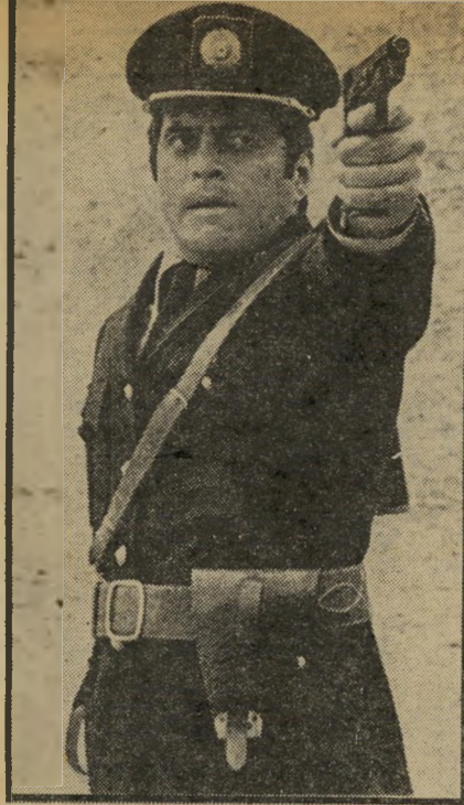
תמונה מתוך "מוות עם שחר" מיסטר אימים בפרו