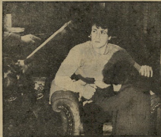
סילבסטר סטאלונה — הפי אנד!

החלק הראשון של הסרט, המפרט את שלבי ההכנה של המיבצע, את גיוס האנשים לצורך זה ואת התווית התוכנית, עשוי בייעולות מיקצועיות המזכירה את סיגנון פעולתו של הבמאי ג'ון סטורג'רס בהזדמנויות דומות קוד-מות (למשל הבריחה הגדולה), אולם משעוורת הפעולה לעיירת-החוף הבריטית שבה צריכה להתבצע החטיפה, נכנס לתמונה גורם רומנטי המסרב את התקדמות הסיפור. ואילו הסוף, שאינו יכול שלא להציג את העימות בין הנא-צים הטובים (כי כל המשתתפים בפעולה הם אבירים אצ-לי-נפש) לבין אנגלים ואמריקאים שכישוריהם עומדים לא