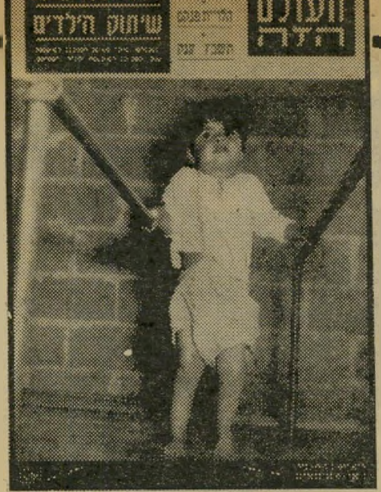
"העולם הזה" 773 תאריך: 21.8.52

בשער הגיליון: תצלום של ילדה משותקת המנסה לפסוע בין מטקי ברזל.