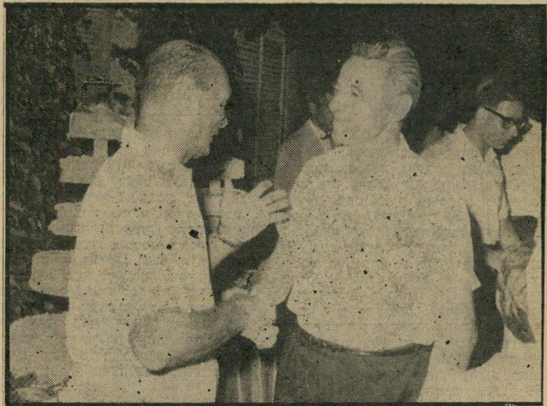
מנטש עם משה דיין טיפשע מאורגן

יעקבלה הוצג כשליט העולם התחתון הישראלי וכמי שעל פיו יישק דבר. הטע" נה כאילו יש פיקוד אחיד לעולם התחתון בישראל מגלה בורות מדהימה. עולם ה" פשע נחלק לחברות-חברות, ושאר הנאות נשמעת לרעותה וכל חבורה פועלת בנפ" רד. בתל-אביב, למשל, פועלות חבורות כמו הכרם, יפו, בתיים. מלבדן עוד הבור" רות בסכונות השונות. מנהלג בתיים, נסים לביא, אפילו לא יאזין לאנשי הכרם.