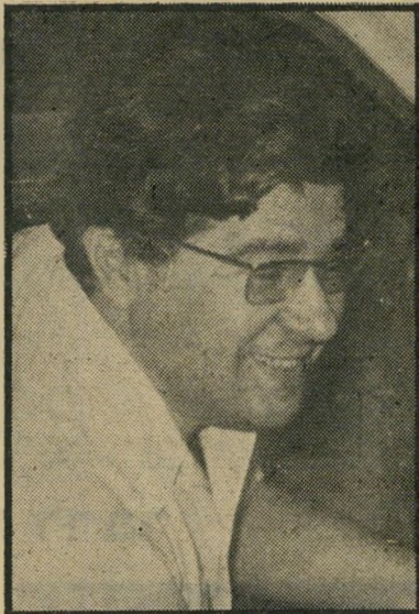
יועץ-מישפטי ברק יועץ-מישפטי ברק טריקת דלת

וזהי דוגמה נוספת כיצד עלולה העובדה ששר בממשלה או בני-מישפחתו הם בעלי רכוש ומיפעלים שבתחום משרדו של השר להשיע על שיקולו והחלטותיו. ייתכן, וקרוב לוודאי, שבמיקרה זה לא נבעה החלטתו של השר הורביץ שלא להעלות את מחירי אבקת-החלב משום שיקול ה קשור במחלבות שאותן העביר עם מינויו כשר — לבניו. אבל די בעובדה שבני-מישפחתו של השר עשויים ליהנות מהחלטתו כדי לצרום ולהיראות כפגם אסתטי. פרשה דומה עלולה להתעורר גם לגבי (המשך בעמוד 36)