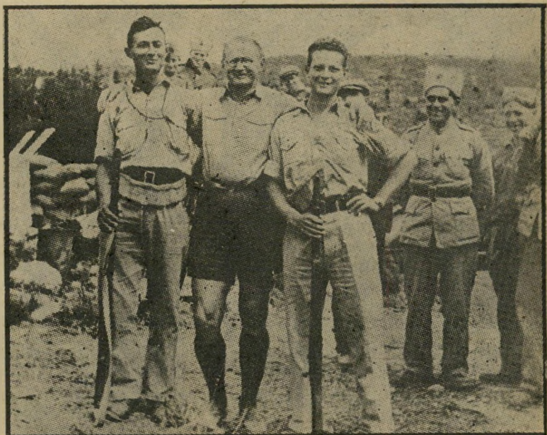
שדה עם יגאל אדון ומשה דיין ביום העלייה לחניתה בין הצבא לאדמה