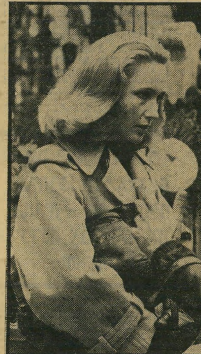
שחקנית בריגיט פוסי החינך המסויים

החלק היחיד בסרט הצולם מעט את העין הוא הניסיון להסביר את התנהגות הגיבור כתוצאה של אהבה ניכזבת בתור ספת זכרונות ילדות. מוזר עד כמה בסיג-נונו החופשי הזה, ללא מיסגרת עלילתית מוגדרת ומפושטת, מזכיר טריפו קולונרין אחר לגמרי — פליני. נדמה שכמו פליני החליט גם טריפו לעשות סרטים סרטיים ואינטימיים, הנראים כמו התפרצות ספונה סאנית של דברים המתבשלים בתוכו.