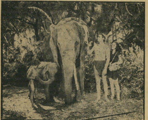
מישפחת טרון — שרידי הג'ונגל

מקדחת ג'ונגל. טרון אינו יכול לשרת את הביון-הבריטי משום שאין לו חליפות מהודרות והוא מדבר בלשון עילגת ורק בזמן הווח. אבל כשפורצת אצל מישחו ברחוב תיגרה רגילה קל יותר לסמוך על שריריו של בן-הקופים המתורבת מאשר על האנוש המתוחכם.