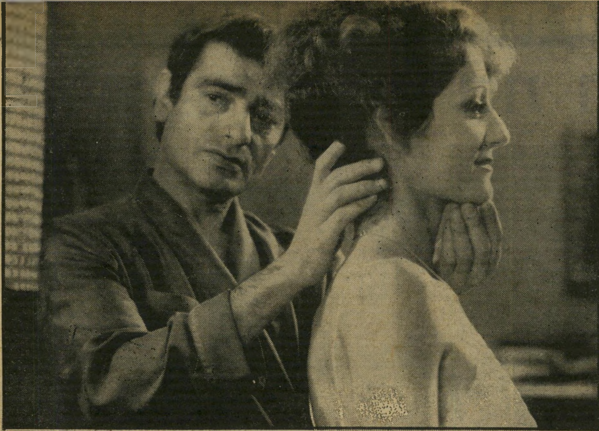
גיבור הסרט (השחקן שארל דנר) ואחד הראשים שהוא אוהב יפות, יפות, שבא לבכות!

על ההוצאה-לאור של הספר (ברייג'ס פוסי), אבל הוא מטייל בחופשיות בין הזמנים, כשבעצם לא תמיד ברור וגם לא חשוב מה קרה לפני מה.