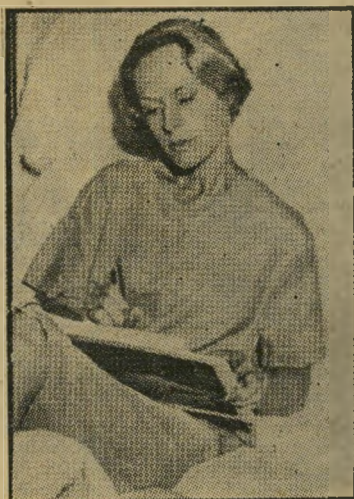
פצועה, טיפי הדרן, במיטה הפיל הכיר אותה —

אבל הצעקה היתה לא רק קולנועית, כי אם מציאותית ביותר. "היה זה הרכה יותר