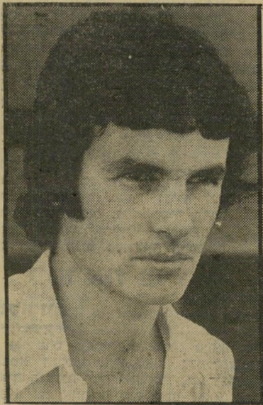
סופר טל-שיר "קצב שלא הכתבת"

כתב עמוס ספר ושייצא לאור. מעבודה לעבודה. מה עבר במהו של השחקן הצעיר כשקיבל את הבשורה. משאת-נפשם של סופרים מתחילים כה רבים? "הכל התרחש באופן מאד לא רומנטי" הוא מתוודה. "לא הייתי חודש שנים ארוכים לתשעבתה של ההוצאה. קיי בלתי תשובה תוך כמה ימים, והעניינים התחילו לרוץ. אז התחלתי להתבונן בי עצמי, אספתי זיכרונות והתחלתי לסדר הכל בראש. מובן שכמו כל בן-אדם קטן גוני הייתי מאד שמח, ויחד עם זאת הרגשתי אחריות מסויימת כלפי עצמי, כיוון שכל מה שקרה - קרה בקצב שלא אני הכתבת. הייתי בן-אדם שתמיד ידע שיש לו מה להציע. הנה פיתאים בא משהו ולקח. כל השנים התייחסתי לעצמי בהעדר רכה הנכונה, הייתי מודע לכוח שפועל