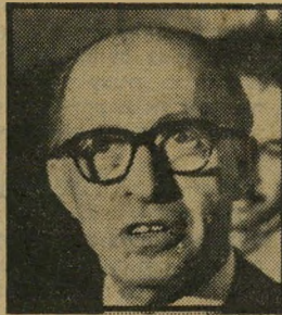
בגין מי הוא מי?