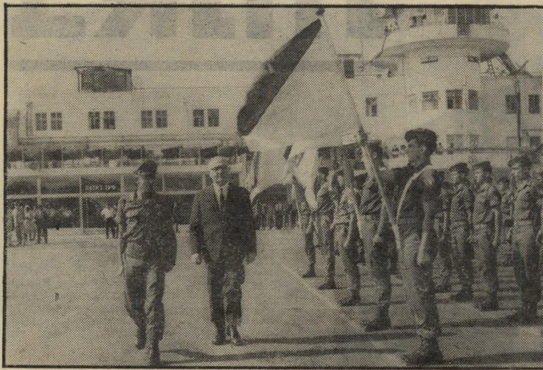
דוד בן-גוריון סוקר מיסדר צבאי בנמליהתעופה בלוד (1951) — מסורת ישנה

טכסיהפרידה הצבאי, שנערך ל-ראשי-משלה מנחם בגין, בצאתו למסעו הממלכתי בארצות-הברית, נראה כה יי-