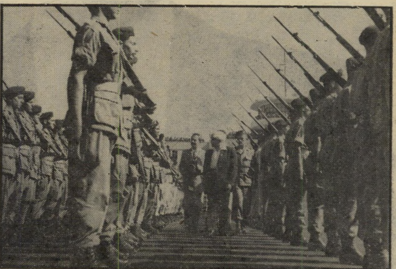
דוד בן-גוריון סוקר מיסדר צבאי בנמליהתעופה בלוד (1951) — מסורת ישנה