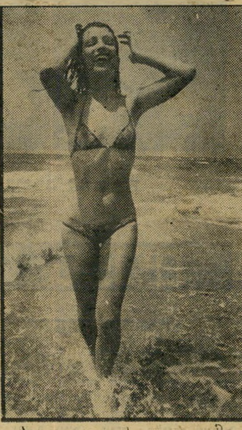
אנדה - הגוף