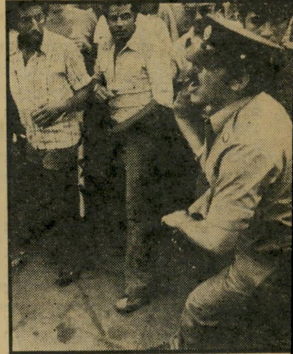
„עוף!“ צועק שוטר מעוצבן ל־ עבר מפגינן, איש הליו־ כוד, שניסה לחדור לתוך שורות המפגינים נגד משה דיין ולעורר שם תיגרה.