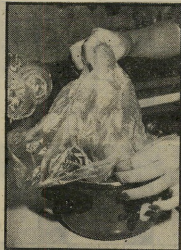
סוף התהליך הידיים עדיין נקיות

למשל: כאשר יש לערבב עיסה כבדה (בצק, סלט כלשהו בכמות גדולה, עיסה של עוגיות-פונז וכו'), ולא רוצים ללכלך את הידיים, מערבבים בתוך סיר גדול. אבל — לערבב בעזרת כף קשה, הכף לעיתים מתעקמת. לערבב בידיים לא נעים — למרות שמאד נוח. העיסה נכנסת מתחת לציפורניים, וזה לא אסתטי ולא היגייני. ללבוש כפפות לא נוח, צילצול-טלפון פית-