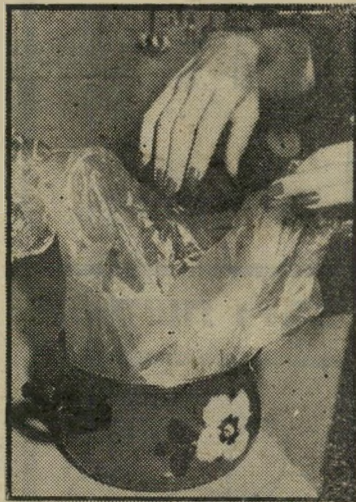
לקראת ההכנה לשמור על הידיים

כשאני לא עוסקה בחיבור הסימפוניות הבלתי-גמורות שלי (אני אלופה בלהתחיל דברנס שסיומם נדחה לזמן בלתי-מוגבל. הדבר נותן לי הרגשה נהדרת. כאשר ייגמר רן לי הרעיונות החדשים — תמיד אוכל