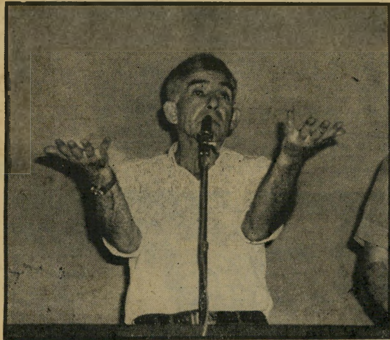
מזכ"ל מתפטר זרמי עדיין מוקדם להבין

החץ: "מה קרה לעבודה? הפסידה, לא? אני לא ערור כעת לראיונות."