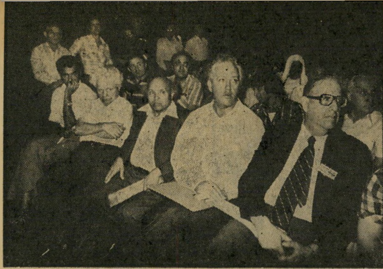
ראשי מיפלגת העבודה בישיבת המרכז אחרי המפלה. אחד אחד ובאין רואה...

רא נכרח! נאומו של פרס התמשך ונמרח לאינסוף. הוא השתדל לשוות ל"קולו את הקריאה המסורתית "אחי ריז" ביקש להישמע כמנהיג, ללכד את השורות, להלהיב ולהרים את המוראל. אבל זה פשוט לא הלך. חברי המרכז החלו השים שנעשה מאמץ