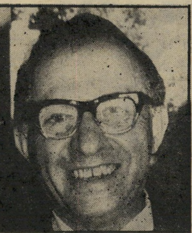
בגין סגן-ראש-הממשלה ושר-החני