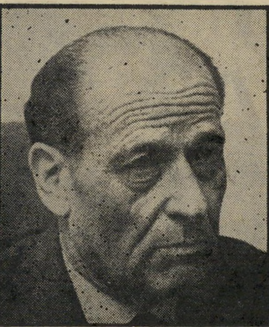
רימלט נשיא המדינה