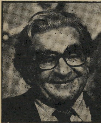
דולצ'ין יו"ר הנחלת הסוכנות

התיכנית המתגבשת והולכת מאח-רי ריי-הקלעים מיועדת לכונן בפעם הרא-שונה בתולדות מדינת-ישראל ממשלה ש"תהיה מושתתת על קולותיהם של שתי המיפלגות הגדולות. אין הכוונה, כפי שני-