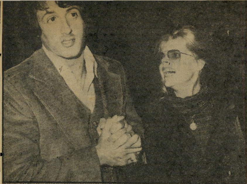
סילוסטר סטאלונה ואשתו ששה מצלמים אותה יותר מדי

לרוקי לא היה סיכוי לצאת מאלמוניותו. מפני שאיש לא האמין בכישוריו. לסטא"לונה לא היה סיכוי, משום שחסר היה לו האמרגן שיתן את הדחיפה הנכונה.