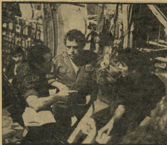
דין, לביא וגאון: ה"הרקולס" שבדרך

קשה להאמין, אבל זה קרה. הצנזורה ראתה סרט — והבינה אותו. ההלם שב"חוויה בלתי צפויה זו היה כה גדול, עד שהתגובה באה אינסטינקטיבית: אסור להציג את הסרט. הסרט שבו מדובר קרוי שבע יפהפיות, ככינויו של הגיבור הראשי בו. עשתה אותו הבמאית האיטלקית לינה (סחף חו"ש) ורטמילר. ואכן, כפי שקבעה הצנ"זורה בדייקנות רבה, הסרט מתאר את תקופת-השואה, וכבוד האדם מושפל בו.