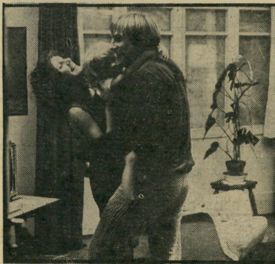
לאוריה ודפארדיה — כך גונבים

ללונה של נפש אבודה, נופל קורבן פח של עצמו. קלו-טילדה הופכת בהדרגה מחפץ מיני שאפשר להשתמש בו בשעת הצורך, חפץ מיני שאינו יודע שובע — ובסופו של דבר, לצורך גופני ורוחני שאין הקבלן יכול להסתדר בעדו.