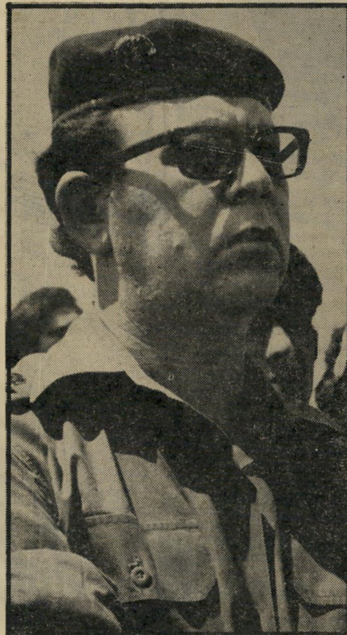
הרמטכ"ל רב-אלוף מוטה גור

ניהוד נכון ונכון של משאבי כוח-האדם הקיצוני היה צריך ליצור מנגנוני-יפוח, שיאפי