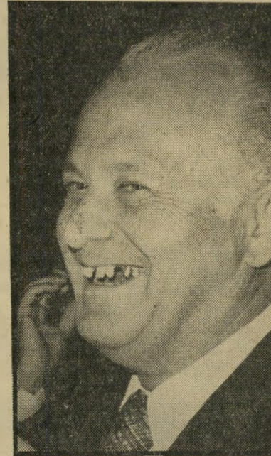
נגיד-יוצא זנבר, שושק המעטים

זכותו של האורח הפשוט, שאין לו כל מעמד רשמי, להתערב בהחלטות הממשלה ולנסות לשנות אותן במידה שהן נראות כנוגדות את כללי הצדקה-טבעי. גישתו של הציבור והמוסר-החברתי, נר-אית כיום כבלתי מעוררת. פרשת אשר