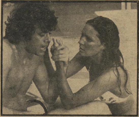
או'ניל וסאראזין - גילגולים מיותרים

הדרך שבה מובילים הבמאי והתסריטאי מאקס אתרליך (שעיבד סיפור מקורי משלו) את העלילה, משאירה מעט מאד ספקות לגבי מה שעומד לקרות, מאחר שהסיסטים הופכים, שיגרתית למדי, תחויות מדוייקות של המציאות. מאידך, מי שמצפה למצוא כאן רמזים דקים לתורת-