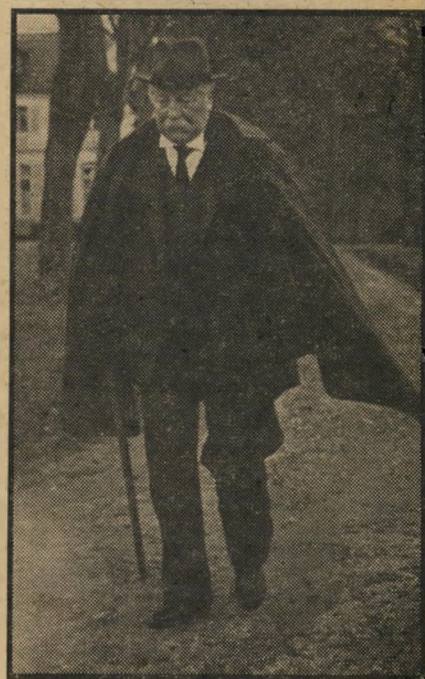
ז'אן גאבן ב"הנשיא" האדמה היא העיקר

כל התיאוריות הללו, של ניקמת המיעוט הכישרוני (היא לומדת עיברית מתקליטים, וזוכה בהערת-ביקורת מפי אחת הדמויות שבסרט, בדבר המינהגים המוזרים של בני-עמה היהודים), היו יכולות להיות יפות מאד אילו לא נוצלו, כמצופה, לצורך עלילת-מתח מלודרמתית למדי, העמוסה בהרבה שאבלונות שיטחיות.