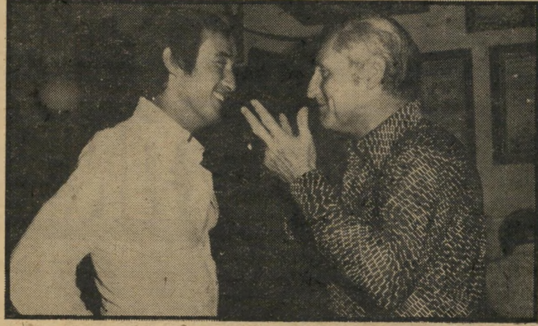
ראש עירייה להם ומיסעדה שאולי דוגמא רעה