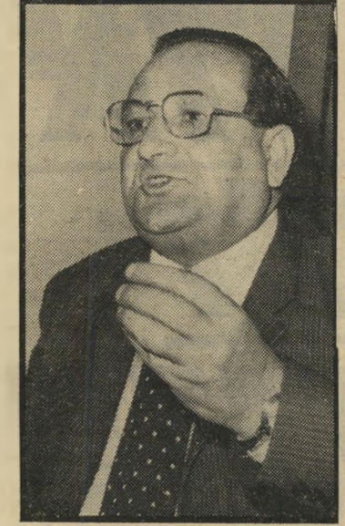
קודט גביש מענג סגור

השניים יצאו במכונית פרטית לנמל-התעופה בן-גוריון בלוד, שם נתן האלי-מוני ללכטמן דרכון עם אשרת-כניסה ל-