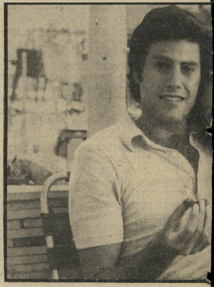
מוקדש ספר שיריה