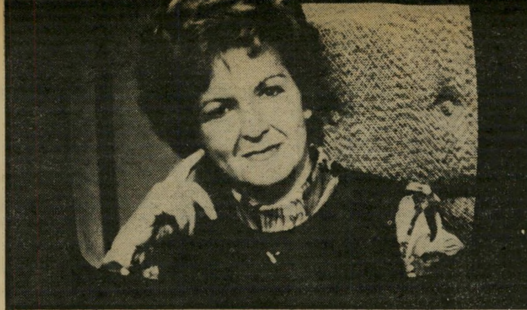
מנחה זמר תיזה מהפכנית