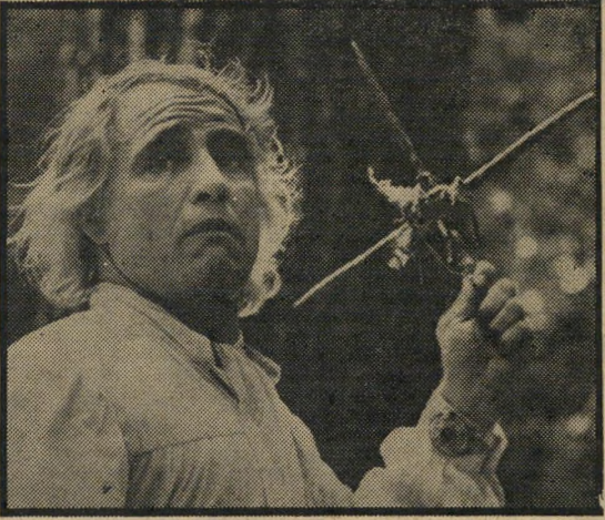
מארלון ברנדו — העתק של קנאי

מכלה את עצמו, צאציו פונים לו עורך וגלמיו קמים כנגדו), מטשטש כל עקיבות של מינה דרמטי או עניין בדמויות. כל דמות היא סמל, שאין לו זכות-קיום כיצור אנושי. הדמות האחת שמתפתחת איכשהו בסרט, נערה משוחררת מבחינה מינית, היא נטע זר לחלוטין בתוך עולמה של עיירה נידחת מלפני 100 שנים (העלילה מתרחשת ב-1880), ואילו השאר הן גרוטסקות גסות. מפליא לעשות מארלון ברנדו, הטופל על דמות הרוצח השכיר הנתון בזווית כה רבות, עד שאין כל צורך בדיאלקטיקה כדי לסלוד ממנו. הוא מתחפש לאשה, יורה ביריביו בגבם, תוקע פגיון דמוי צלב בתוך קורבנותיו, טובל באמבטי-קצף, נראה כאב-טיפוס של קנאי דתי מטורף. באוכפים לוהטים של מל ברוקס זה היה אולי משעשע. כאן, זה פשוט מגוחך.