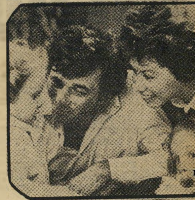
פוק ומישפחתו יחסים ידידותיים

פיטר, המשתכר כ-300 אלף דולר עבור פרק של קולומבו, יעשה רק אחד כזה בשנה. כדי לאפשר לעצמו קצת יותר זמן בסרטים המעניינים אותו, כמו, למשל, דצח על-ידי הריגה, אחד מלהיטי הקיץ, שבו מגלם פיטר בלש נוסח האמפרי בוג-ארט - או, מה שחשוב הרבה יותר, ביצון