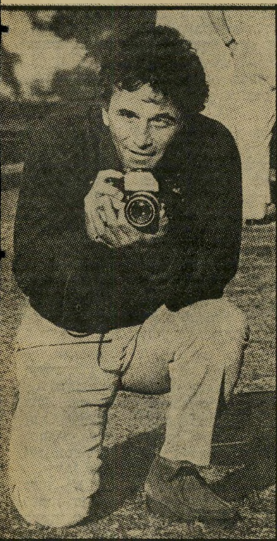
שחקן פיטר פוק אחרי 16 שנים