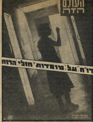
ד"ר על מוסדות חולי הרוח

גם הסכנה של "סוריה רבת", שהיא כלי-כך אקטואלית כעת על רקע מילחמת-לבנון, הועלתה כבר אז בצורה מושלמת. ואפילו הקוריו של השבוע — פריצת נגבים לדירתו של קצין מישטרה בכיר, שלא הרגיש בהם — נשמע אקטואלי מאוד. לראשונה בתולדות העיתונות העברית, הכיל הגיליון דו"ח מצולם על 5 עמודים, ובו תיאור כל המתרחש במוסדות לטיפול בחולי-ירוח. דו"ח זה פירט את הסיפור שבו לוקה הטיפול