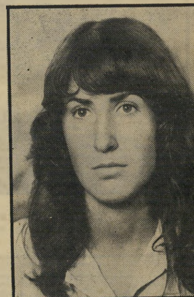
סרבנית-גיוס שממט דיין "לא חחרדים מטפלים בי"

מזנת-מישכל גבוהה. מסתבר שהי סמל-ראשון לא השתכנע שאנחנו דתיים. הורי דתיים, עוד מתקופת בעוריהם בי אלג'יר. ועד אז לא השבנו שצטרך להוריינו כיח למישהו אי-פעם במדינת ישראל שיאנחנו דתיים ומאמינים. לפני חודשיים קיבלתי צורקיה נוסף,