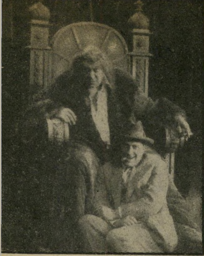
במאי לוביטש לצחוק מהיטלר?

במערכת המוסכמות שבה האמן הסובל נלחם במפלצות מוצצות-סיגרים כדי להשיג את המימון הדרוש להעלאת פירות דימונו הקודח על הבד, ניצב לוביטש בעמדה שהביכה את הכל: מצד אחד, אדם שעמיתיו מתפעלים מכישוריו הנדירים, מן הידע העמוק שלו ומן השלמות שבעבודתו; ומצד שני, העיתונות המעקמת אפה בעדינות. אבל, אפילו עיתונות זו לא יכלה לשלול ממנו מה שכונה, במשך הזמן, "מגע לוביטש".