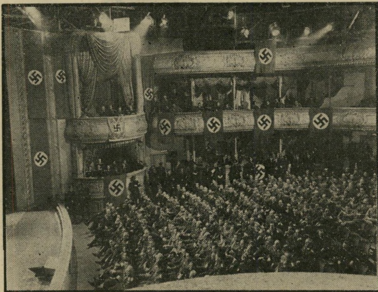
האסיפה הנאצית בוורשה ב"להיות או לא להיות" ...מה שהוא עשה לשקספיר —

כל זה טוב ויפה, ובדרך-כלל אפילו די נכון. אלא שלכל כלל יש יוצא מן הכלל, ויוצא מן הכלל שכזה עומד לשוב בקרוב אל בדי הארץ. שמו: להיות או לא להיות. זהו סרט שנעשה לפני 34 שנים, כמעט כל מי שקשור להפקתו עבר כבר מומן לעולם שכולו טוב, ולמרות זאת הוא עדיין