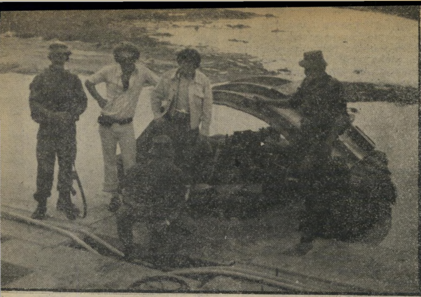
הצוות הישראלי עז נהר קונגה אפריקה מעל לגשר

אפריקה, לכאר כושי, שעד לאותו לילה לא דרכה בו רגל אדם לבן. „אחד הדרום-אפריקאים סיפר לי, שכמה ימים קודם-לכן נורה אדם ציבעוני על-ידי מחתרת ה.סוואפי“ (מחתרת נגד-לבנה הפועלת בנאמיביה) באותו באר. בשל קשר ריו עם הלבנים. כתרניאל) ואני, יחד עם כתבייהעיתונות והטלוויזיה ציפצפנו, כי כניסנו לבאר זה, על חוקייההפרדה של דרום-אפריקה וכולנו, יחד עם אותם פקידים שהצטרפו אלינו, היינו צפויים לעונשי מאסר.”